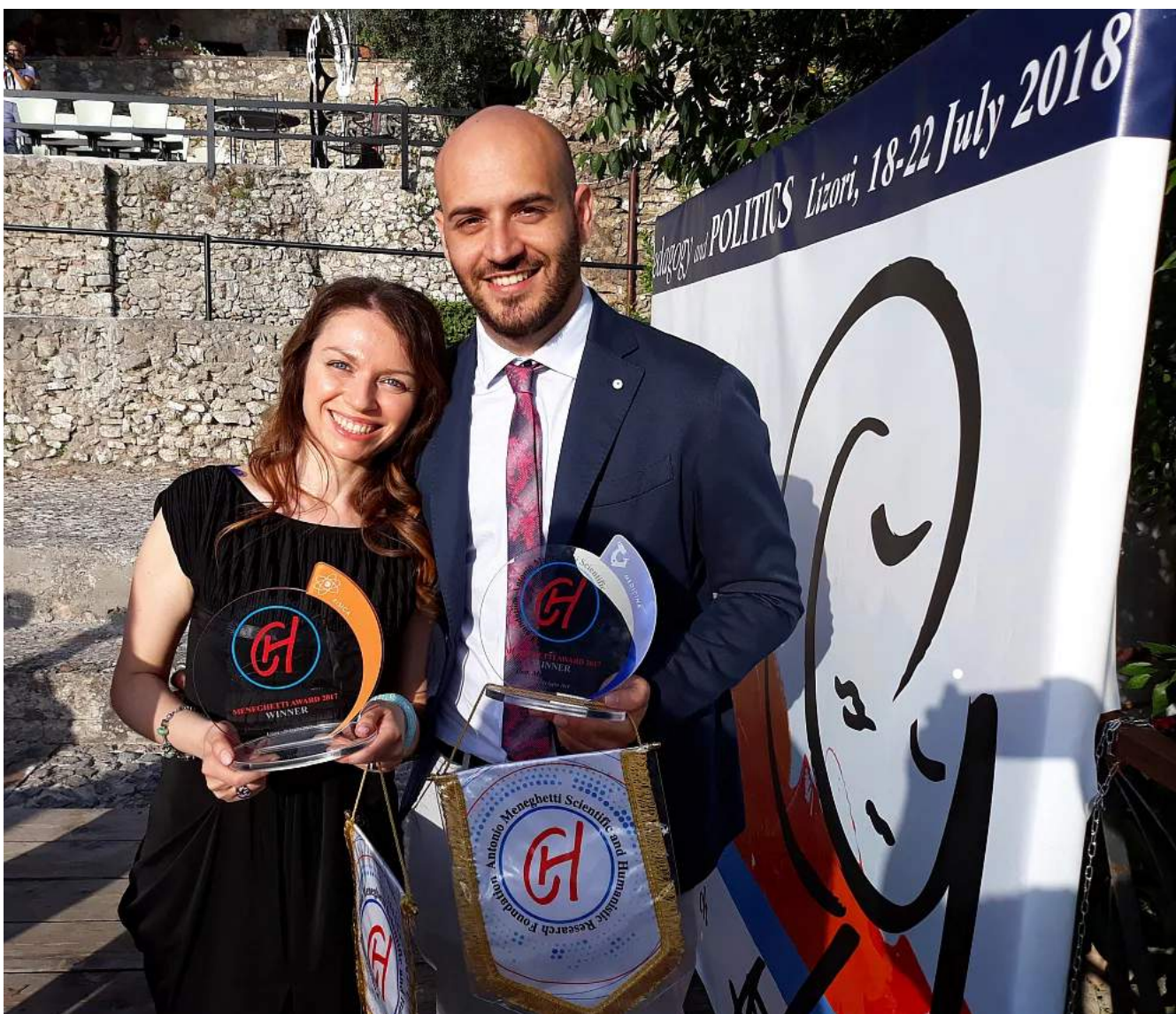
( https://www.corrieredelleconomia.it/2018/07/27/meneghetti-award-riconoscimento-per-due-neolaureati-di-unipg/ )

Meneghetti Award: riconoscimento per due neolaureati di Unipg ( https://www.corrieredelleconomia.it/2018/07/27/meneghetti-award-riconoscimento-per-due-neolaureati-di-unipg/ )