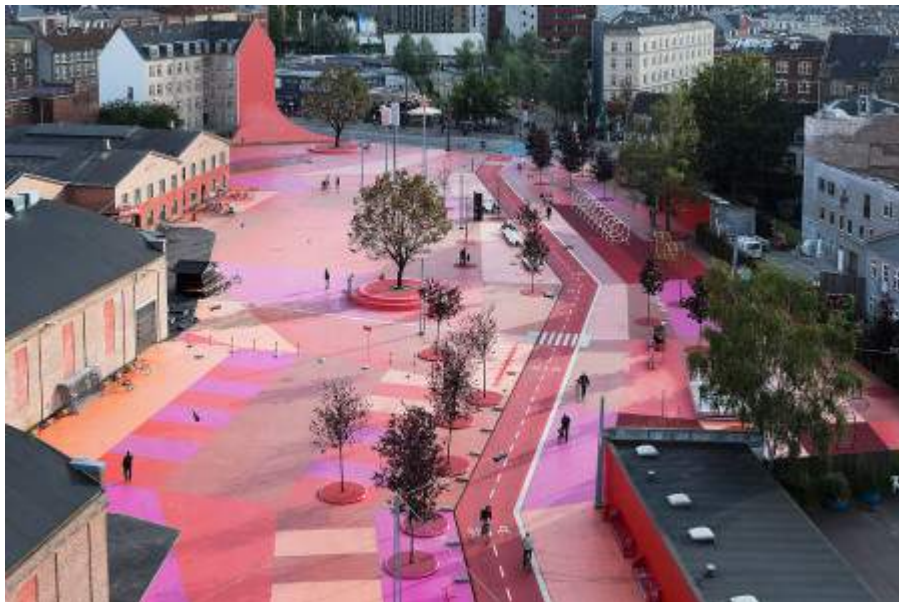
Superkilen, piazza Copenaghen

Sicuramente l’ospite più atteso della sezione architettura e design della kermesse estiva organizzata dal Comune di Assisi, è il giovane e già “archistar” Bjarke Ingels